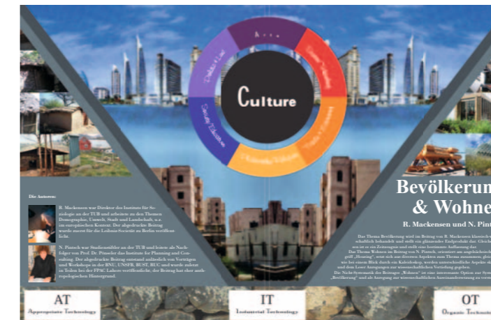
Band 2 Bevölkerung & Wohnen , 2017