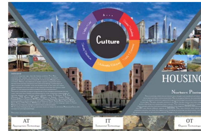
Band 1 Housing , neue, überarbeitete und übersetzte Ausgabe 2017