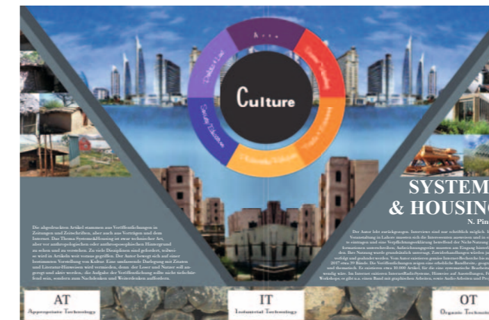
Band 3 Systeme & Housing , 2017