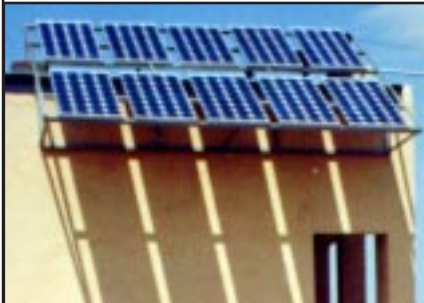
Frauzentrum von Süden mit Solar-Panelen.

Components like charge controllers, batteries and inverters need replacement at these 19 villages costing four million dollars.