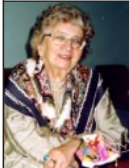
Prof. Dr. Schimmel mit Spielkamel vom Projekt TGD in der Hand

Verständnis für diese Religion zu wecken. Immer bemühte sie sich um die Vermittlung islamischer Kultur an den Westen und umgekehrt. Genau dies hat sie seit den vierziger und fünfziger Jahren getan und mehr als achtzig wissenschaftliche Standardwerke hervorgebracht, von denen einige auch hohe Verkaufsziffern erreichten.